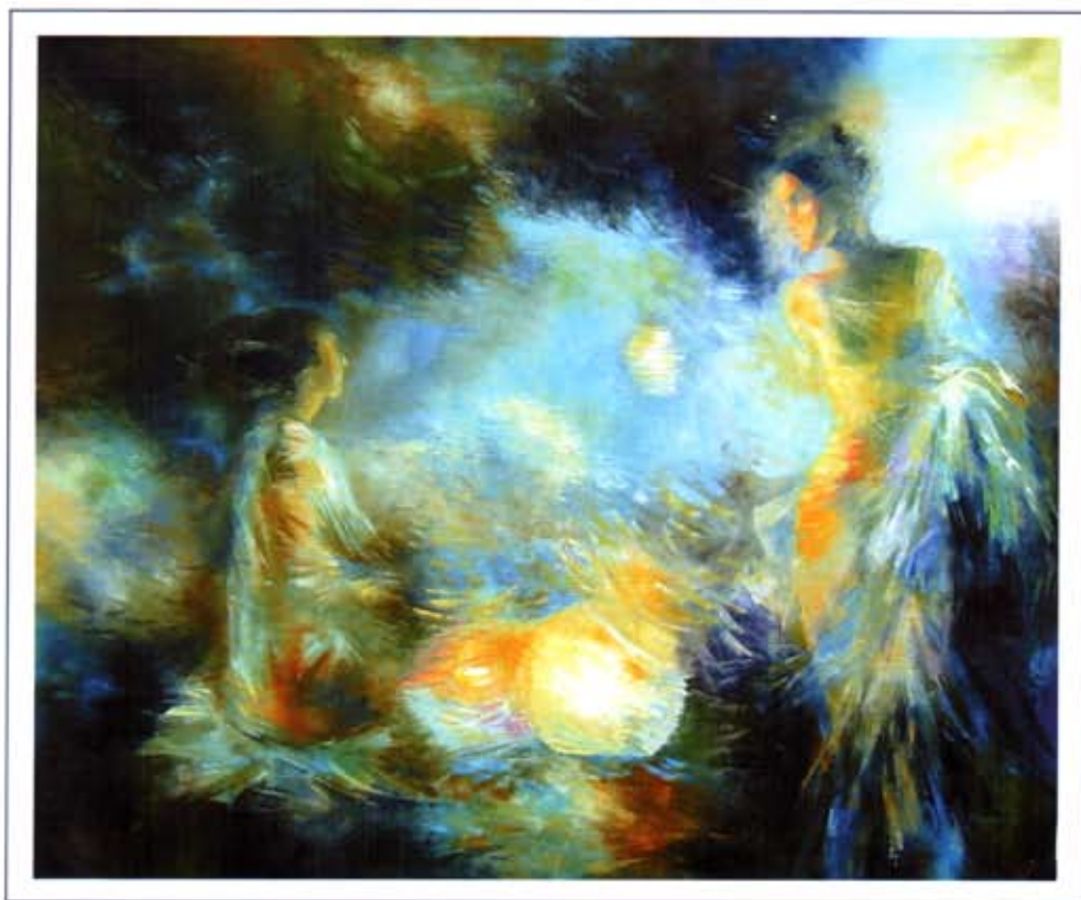
«Ловцы душ». 2005 г., холст, масло, 80 x 100