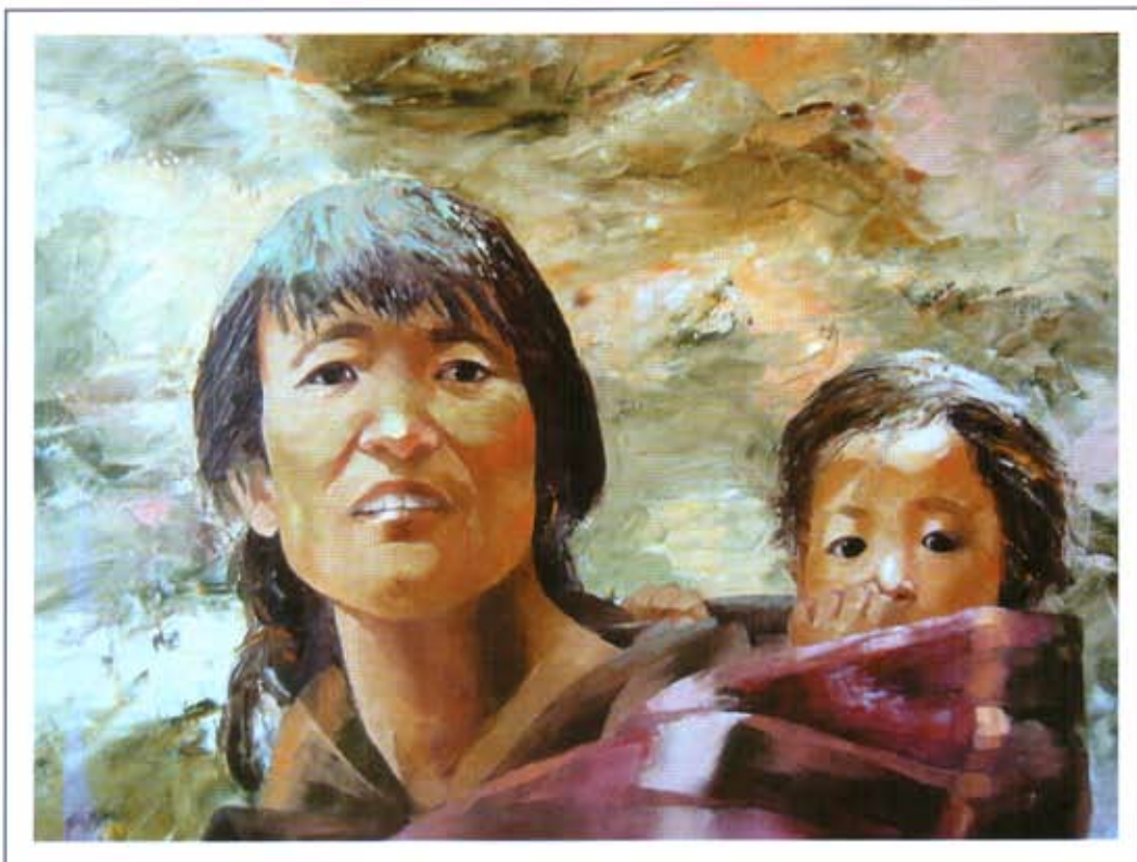
«Тибетская мадонна». 2004 г., холст, масло, 60x80