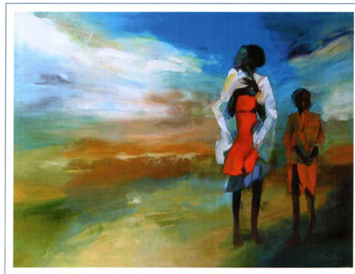
«Ветер». 2004 г., холст, масло, 80 x 60