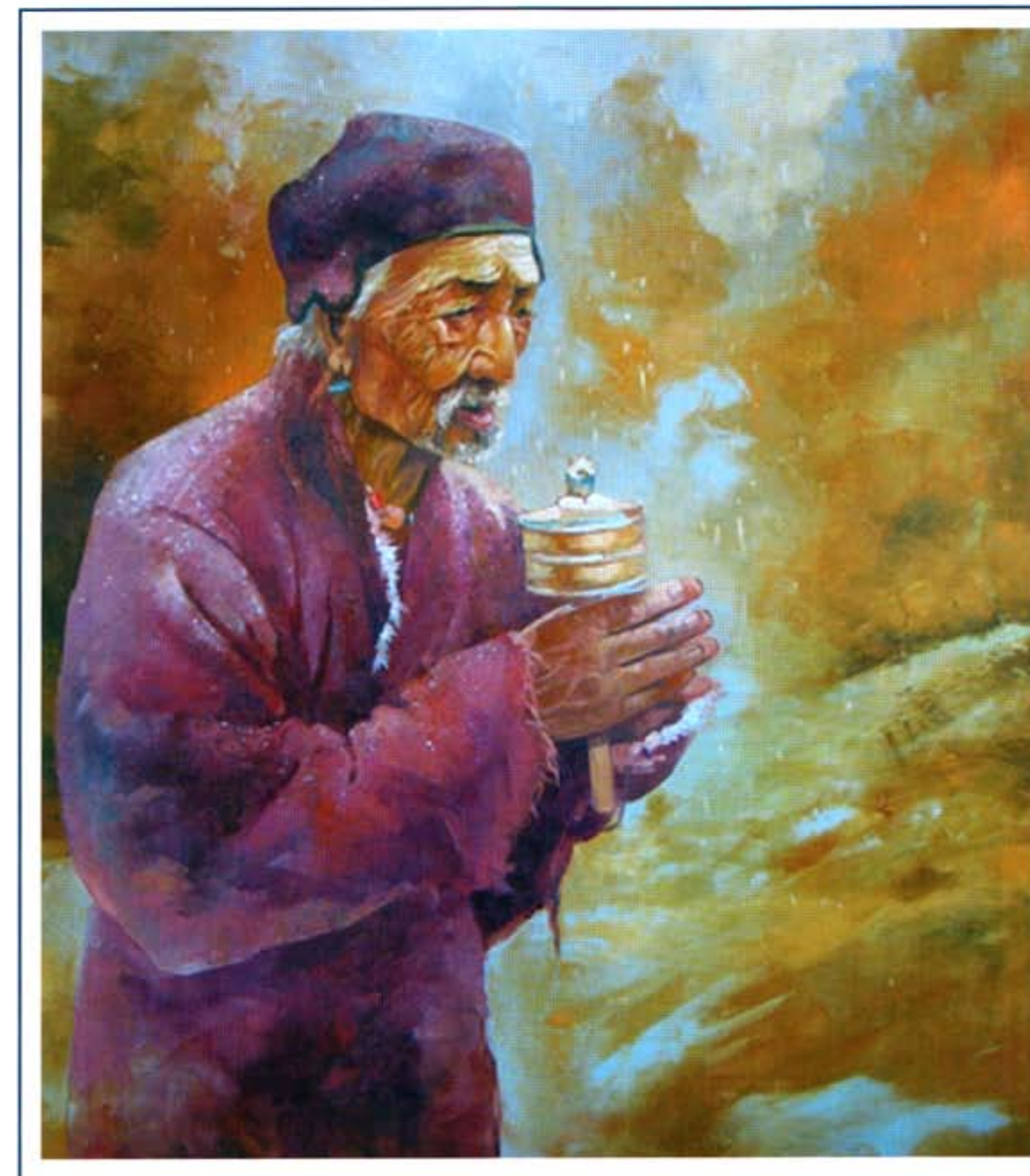
«Последний снег». 2002 г., холст, масло, 60x70