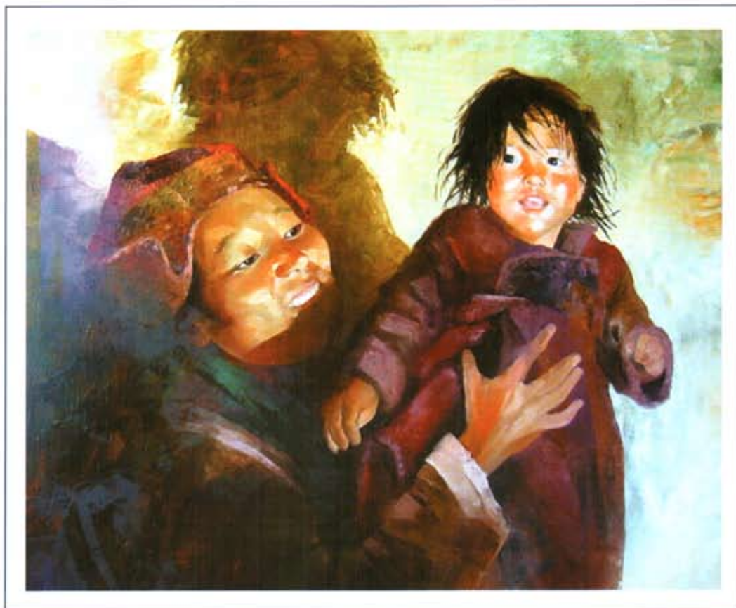
«С ребенком». 2004 г., холст, масло, 60x80