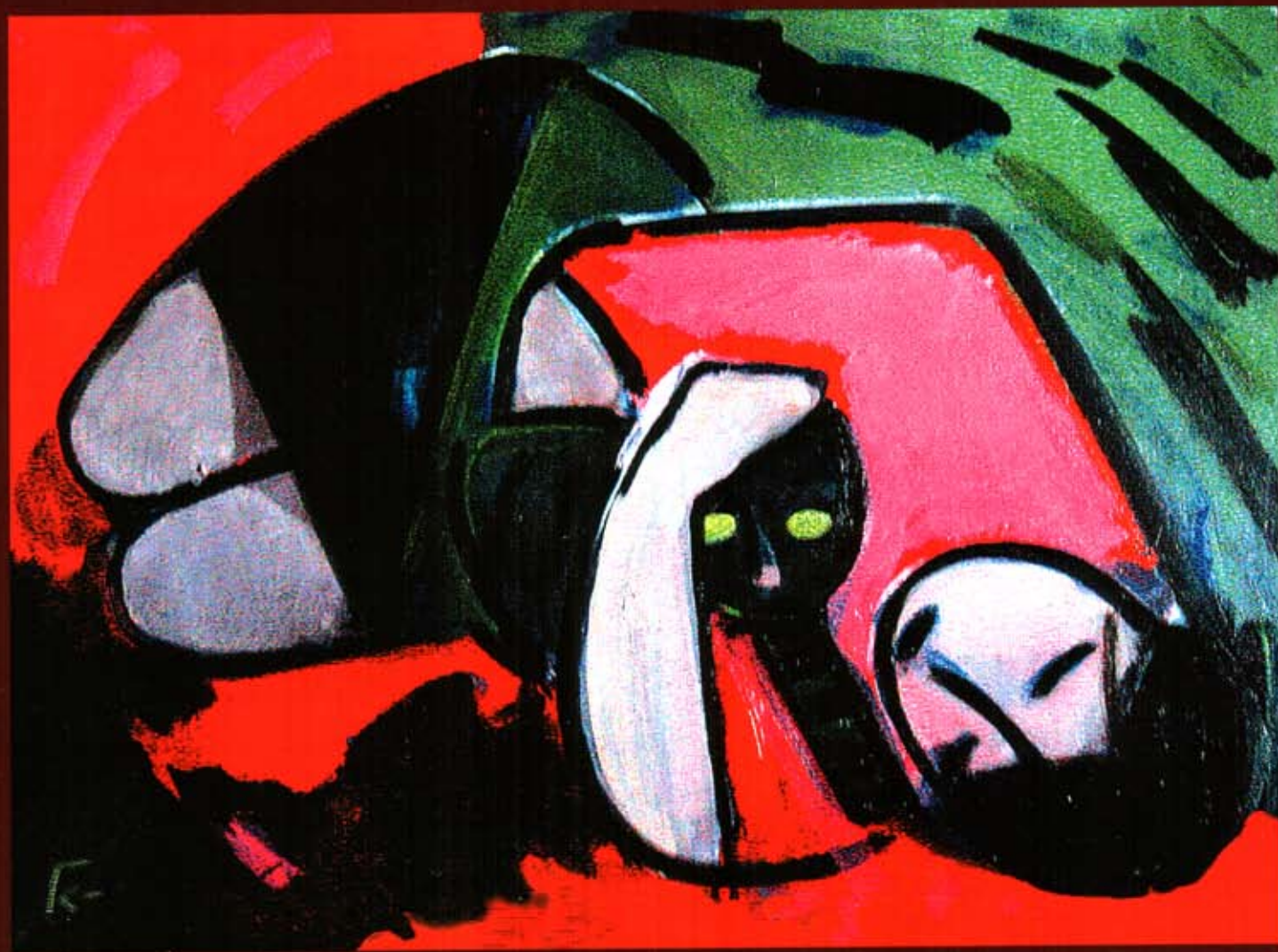
Георгий Ковенчук «Жанна с кошкой»