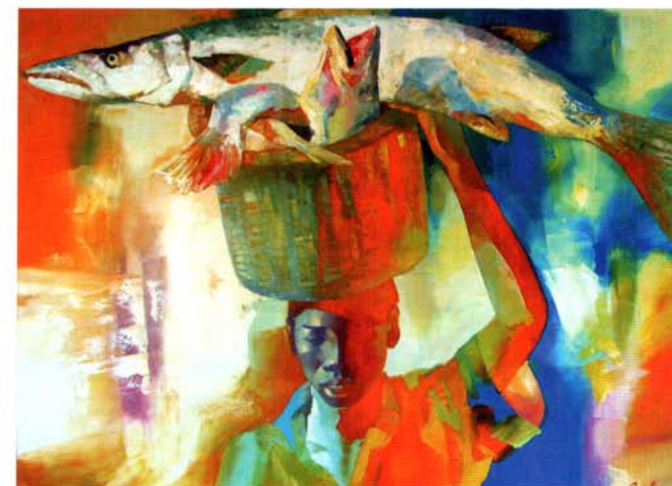
«Девушка». 2004 г., оргалит, масло, 80 x 60