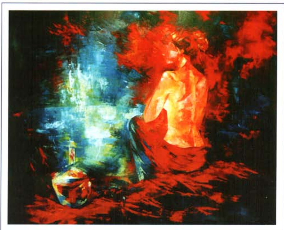
«Красное вино». 2001 г., холст, масло, 100 x 120