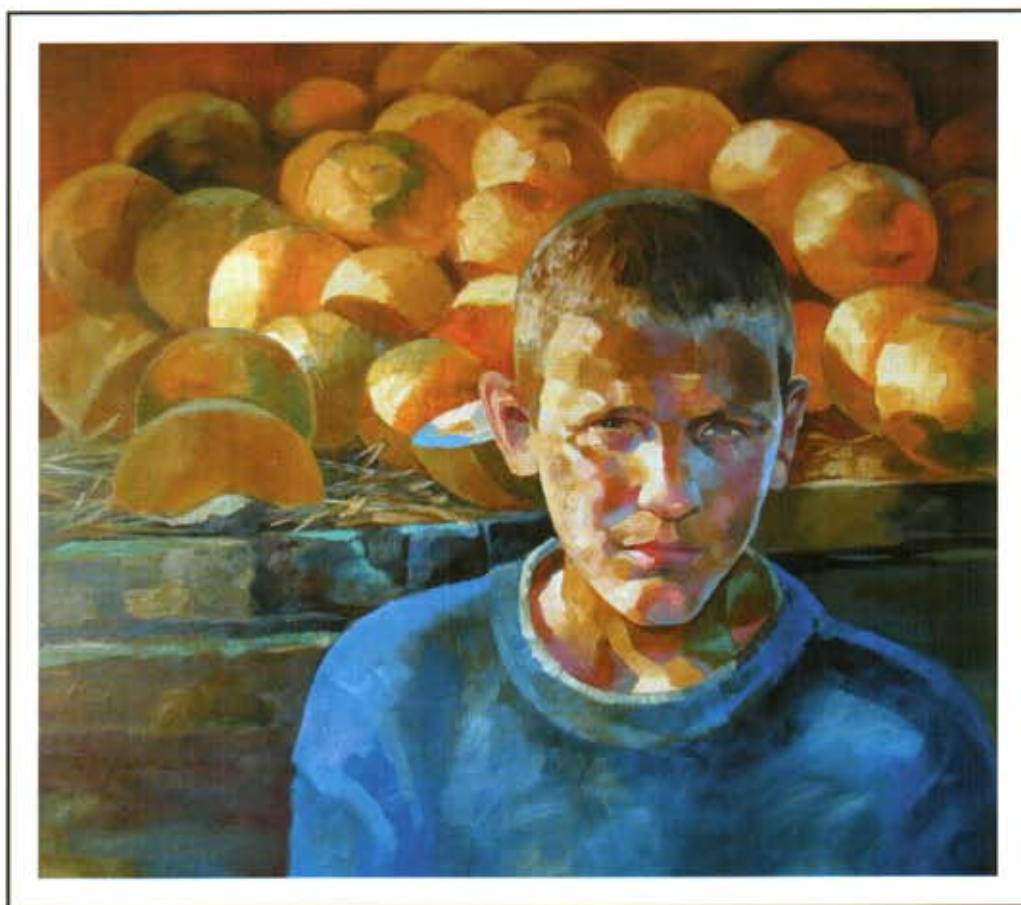
«Продавец дынь». 2007 г., холст, масло, 70 x 80