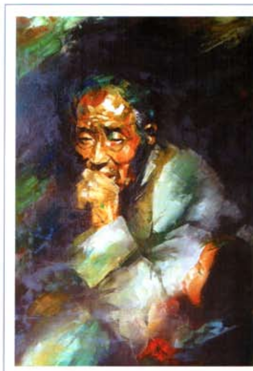
«Мысли». 2004 г., холст, масло, 80 x 60